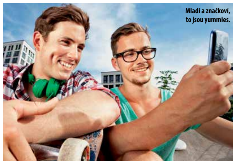
Mladí a značkoví, to jsou yummies.

Yummymu je mezi osmnácti a pětadvaceti. Je to nejnovější trend, kterým jsou média posedlá. Jde o mladého samečka z města. To ostatně napovídá i původ jeho jména – young urban male, tedy „mladý muž z města“. Yummies jsou lidé, kteří nemyslí na budoucnost, na kariéru ani na založení rodiny. Chtějí ale být bohatí, tedy bohatí alespoň natolik, aby si mohli kupovat drahé a značkové věci, hlavně poslední vychytávky od Applu. Yummy chce mít skutečně jenom to nejlepší, takže si skočí do drahé trendy restaurace i přesto, že nejspíš večer bude o hladu, protože už mu na večer nezbudou peníze. Ale co, hlavně že má ten nový vychytaný tablet, kvůli kterému se pěkně zadlužil. Zdá se, že yummies víc ke štěstí nepotřebují. Tedy vlastně ano, hlavně nechtějí dospět. Bydlí totiž u rodičů, a až jim bude třicet, bude to vypadat vážně divně. Jenže yummymu nikdy třicet nebude. Tedy alespoň v to doufá. Zdá se, že jde o projev mužů, kteří si nepřejí žádné závazky, a jedině, co jim dokáže zvednout sebevědomí, jsou právě značkové věci. Termín vznikl díky marketingové studii bankovního domu HSBC, v níž byl horký fenomén poprvé pojmenován.