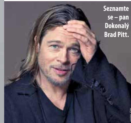
Seznamte se – pan Dokonalý Brad Pitt.

Muži si prý totiž uvědomili, že být krásný nestačí. Je potřeba být krásný, a navíc ještě oduševnělý. Je to tedy jakýsi životní styl, kdy si muž zakládá na tom, že pečuje o svou