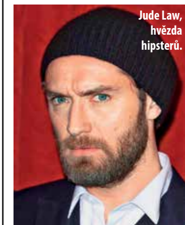
Jude Law, hvězda hipsterů.

Nosí vousy, oblečení, které občas vypadá jako vytažené z popelnice, ale zároveň je drahé a značkové (i když značka je na něm vidět jen málokdy), a hlavně je eko! Oblíbeným doplňkem je šála, která se nosí i v létě, a teplá čepice. Hipster má své kořeny už v devadesátých letech a možná ještě dál. Je to jakási reakce na konformní maloměstství. Hipster je rebel, ironik, člověk nad věcí. Hlavně pohrdá konzumem. Do KFC nevkročí, ani kdyby měl umřít hladu. Poslouchá alternativní muziku, ideálně jazz. Jezdí na starém kole bez světel a přehazovaček, nakupuje na farmářských trzích, k obědu chodí do bio restaurace a čte náročnou literaturu. Přesto je milovník moderních technologických vymožeností. Přisáhá na firmu Apple nebo Linux. K ženám se chová s úctou a láskou a nebojí se v sexu experimentovat, protože je povznesen nad tradiční morálku. Není pro něj problém žít v otevřeném vztahu, tedy mít milenky, a i když se rozhodne založit rodinu, zpravidla se kvůli tomu nežení, svatbu považuje za maloměstský přežitok. Pokud někdo hipsterství nenávidí, tak výrobci holítek. Hipsteři totiž vrátili do módy vousy, kterých se metrosexuálové tak rádi zbavovali. O tom, že nejde o výmysl, ukazuje zpráva agentury Bloomberg – podle ní došlo k celosvětovému poklesu v prodeji žiletek Gillette na konci loňského roku skoro o osm procent. Vypadat jako zarostlý bezdomovec je prostě in.