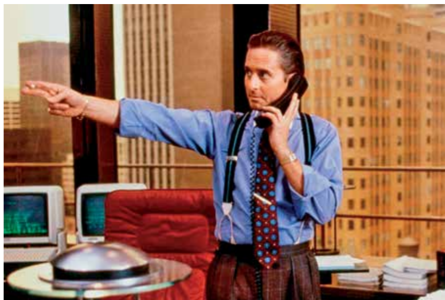
Yuppie vydělává dost peněz a nebojí se to dát na odív jako Michael Douglas ve filmu Wall Street.

Předchůdce metrosexuála, který pře-tr- val i do dnešních dob. Pojem má své kořeny v osmdesátých letech. Jde o muže ve věkovém rozmezí 25 až 40 let, kteří mají reprezentativní (a zároveň náročné) zaměstnání. Vydělávají opravdu hodně peněz, které utrácejí za luxusní zboží a služby. Název vznikl ze zkratky YUP – young urban professional, tedy mladý městský profesionál. Yuppies se mimo jiné vymezovali vůči kultuře hippies, kterou pohrdali. Chronický únavový syndrom má díky nim také alternativní název, říká se mu yuppie flu, tedy chřipka jupiků.