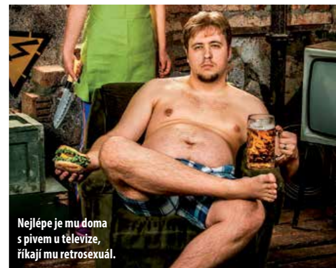
Nejlépe je mu doma s pivem u televize, říkají mu retrosexuál.

Opak übersexuála. Pije pivo, jí nezdravě, na vzhledu mu nezáleží a chodí na fotbal. Jestli mu na něčem naopak záleží, tak vypadat jako drsňák a snažit se co nejvíce přiblížit představě mužů z dob před érou šedesátých let. Zásadně neprojevuje své city a do domu si pozve řemeslníka jedině poté, co vyzkouší deset způsobů, jak si poradit sám. Zpravidla pak při návštěvě řemeslníka není doma, protože dívat se na jiného muže, jak vyřeší problémy jeho domácnosti, je pro něj naprosto traumatizující, což je slovo, které správný retrosexuál rozhodně nepoužívá. Symbolem retrosexuála by určitě mohl být Earl Hickey ze seriálu Jmenuji se Earl, případně Baloun z Osudů dobrého vojáka Švejka.